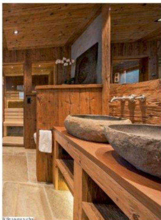
W tej saunie sucha