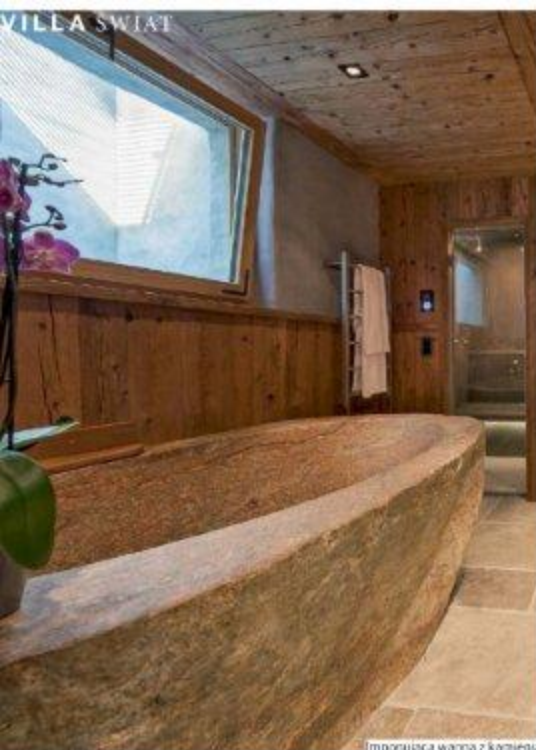
Imporująca wanna z kamienia