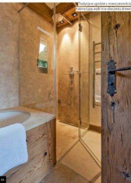
Tradycja w zgodzie z nowoczesnością. Kabina typu walk-in w otoczeniu drewna