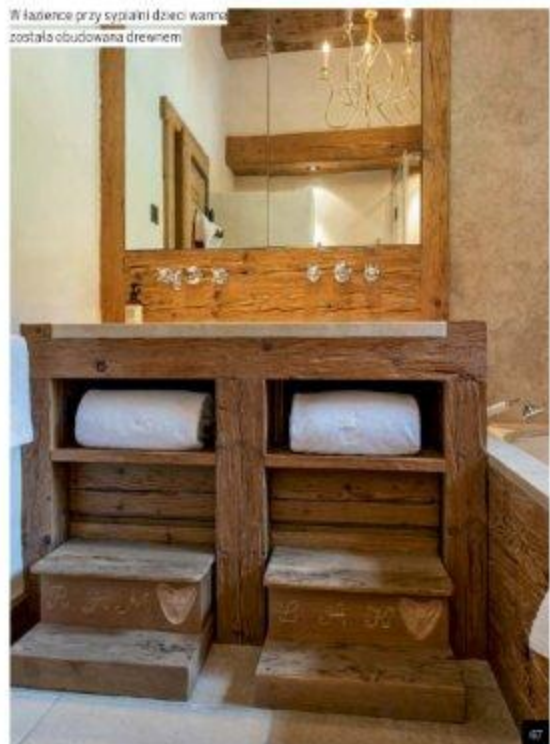
W łazience przy sypialni dzieci wanna została obudowana drewnem