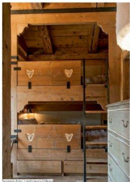
Sypialnia dzieci z piętrowymi łóżkami