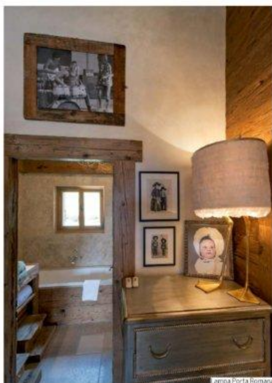
Lampa Porta Romana